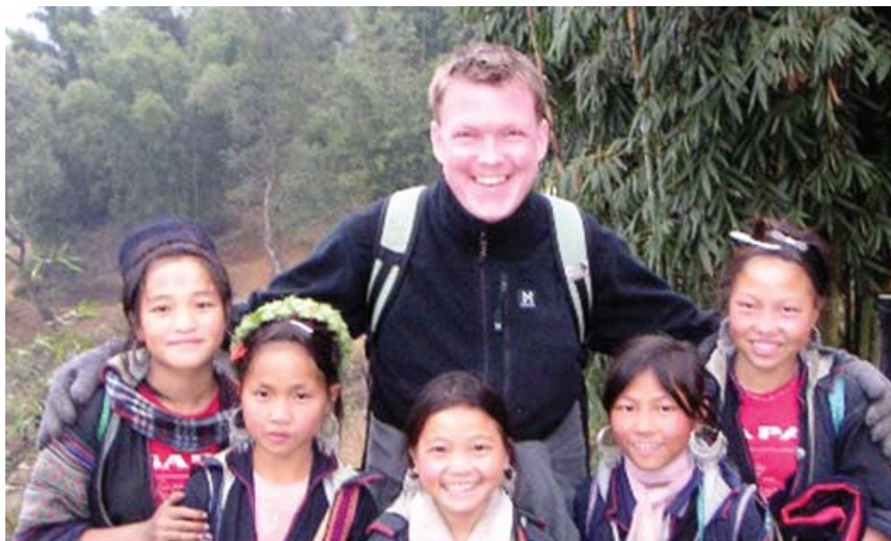
Billede fundet på en af Jakobs hjemmesider. Vi tager et forsigtigt gæt på at det er fra Sydamerika.

af filer og informationer mellem en stor mængde af brugere uden om centrale servere. Teknologien fik sit gennembrud i forbindelse med udveksling af musik og film gennem tjenester som f.eks. Napster, LimeWire og Gnutella og blev derfor hurtigt et varmt emne blandt musik- og filmindustrien, der søgte at kræve tjenesterne lukket på grund af de store mængder ulovligt kopieret musik og software, der blev udvekslet. Forskellige indgreb og myndighedsinitiativer var blot med til at styrke fællesskabet mellem brugerne og førte til nye og avancerede metoder til udveksling af filer, ikke mindst oprettelsen af mere lukkede fællesskaber, hvor kun særligt interesserede brugere kan deltage i udvekslingen.