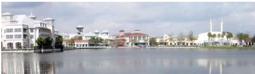
Celebrations arkitektur signalerer en forkærlighed til fortiden.

gerne i Celebration kaldes) føler, at der kommer alfestøv ud alle vegne.