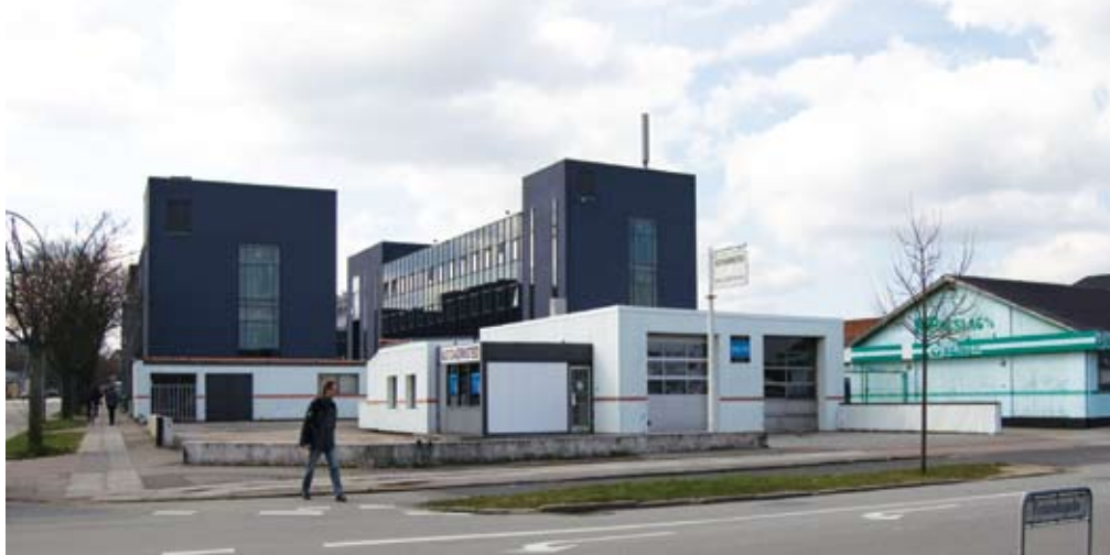
Af Rikke S. Lindhard, Medievidenskab, 6. semester

Der er noget i luften omkring Katrinebjerg for tiden. Er det måske den lune og længeventede fornemmelse af lysets og forårets komme, der både indbefatter den årlige KAPSEJLADS og de lange lyse aftener med grillfester i Botanisk Have? Eller er det den knugende fornemmelse i maven ved tanken om de forestående eksaminer, der rykker nærmere dag for dag, og hvor tanken om overforbruget af koffein og søvnløse nætter indprenter sig på hornhinden?